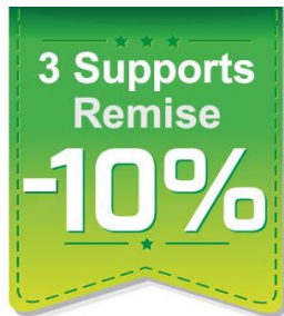
3 supports achetés 10% de remise