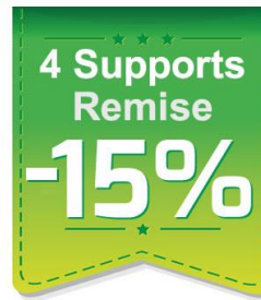
4 supports achetés 15% de remise