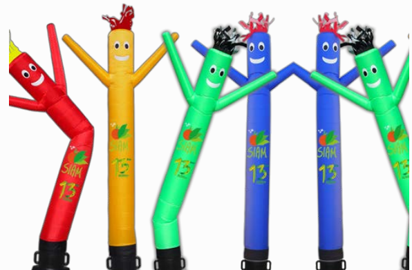
Sky dancers personnalisée