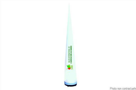
Cône debout avec marquage logo

Valorisez votre présence et vos innovations grâce à une gamme d'outils visant à faciliter vos contacts et accroître votre visibilité sur le salon.