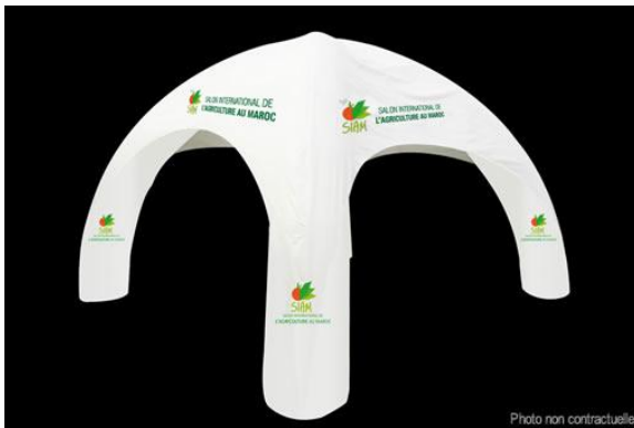
Dôme gonflable personnalisée