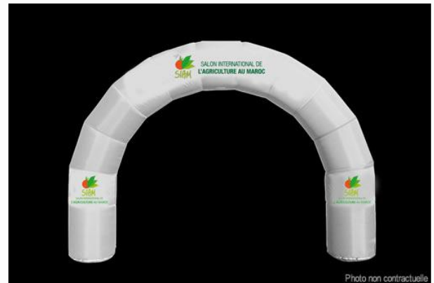
Arche d'entrée gonflable : parfait pour identifier votre accueil pour vos dégustations